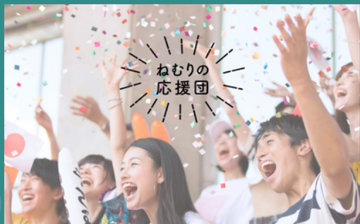
▲3社目：睡眠に関する取組 (NTT PARAVITA)

企業に勤めているとこのような感情を多少なりとも感じたことがあるのではないのでしょうか。