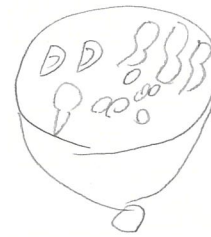
作ったみそ汁の写真または絵