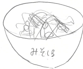
作ったみそ汁の写真または絵