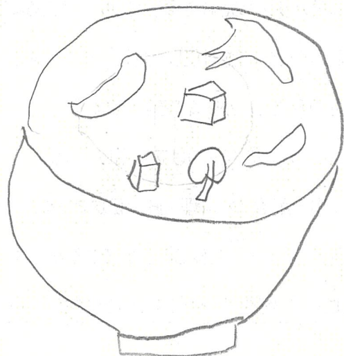
作ったみそ汁の写真または絵