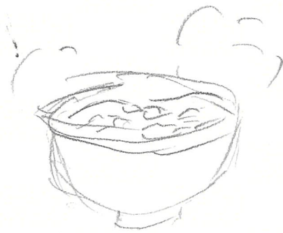
作ったみそ汁の写真または絵