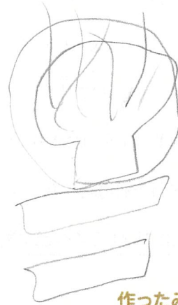
作ったみそ汁の写真または絵