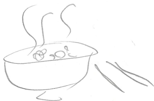
作ったみそ汁の写真または絵