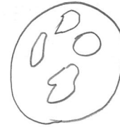
作ったみそ汁の写真または絵