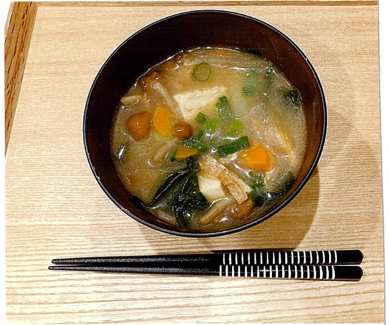
TFづくりにみて、汁の与具または紙