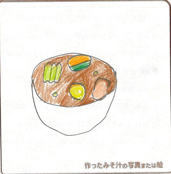
作ったみそ汁の写真または絵