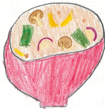
作ったみそ汁の写真または絵