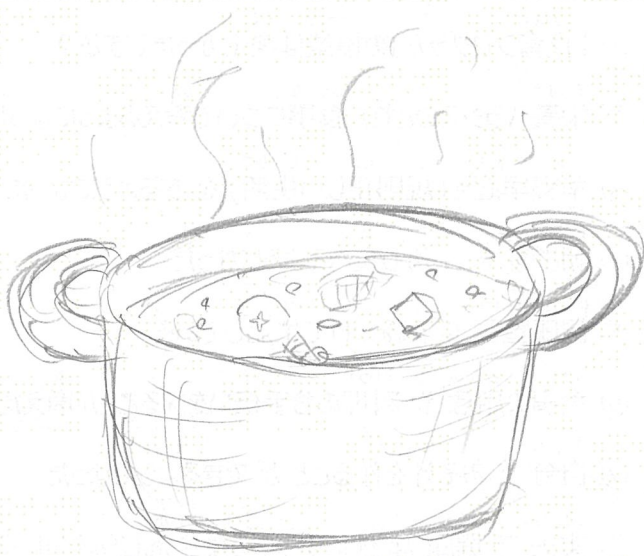
作ったみそ汁の写真または絵