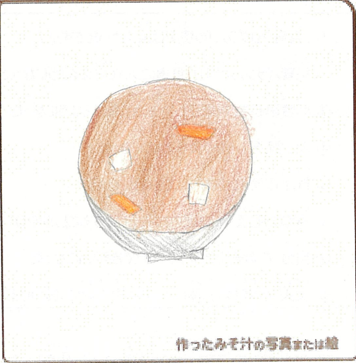
作ったみそ汁の写真または絵