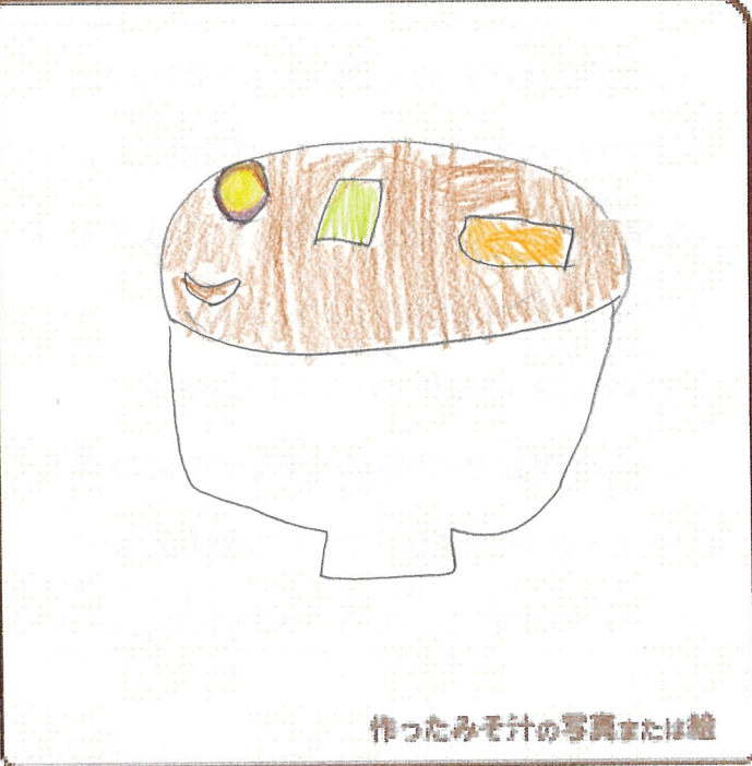
作ったみそ汁の写真または絵