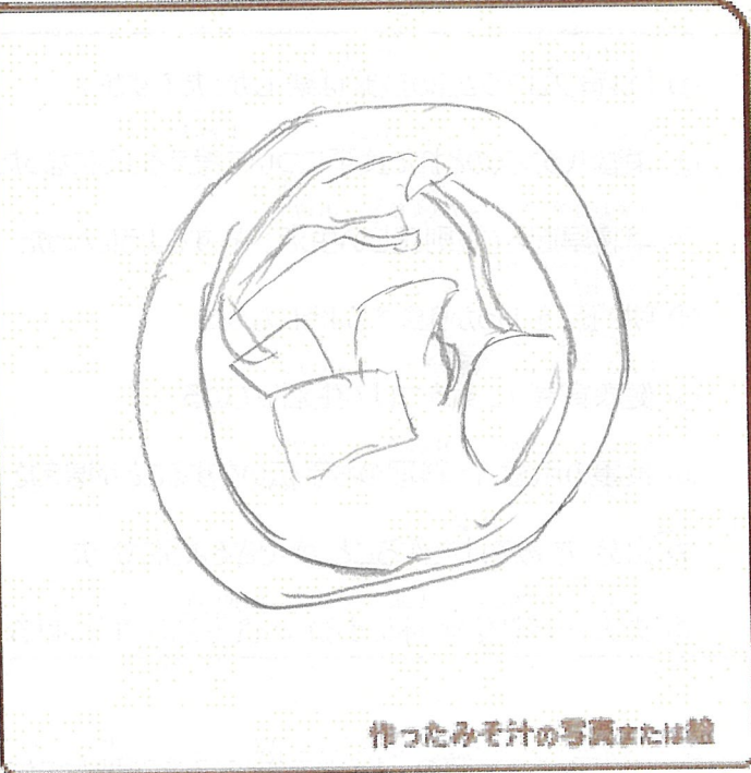
作ったみそ汁の写真または絵