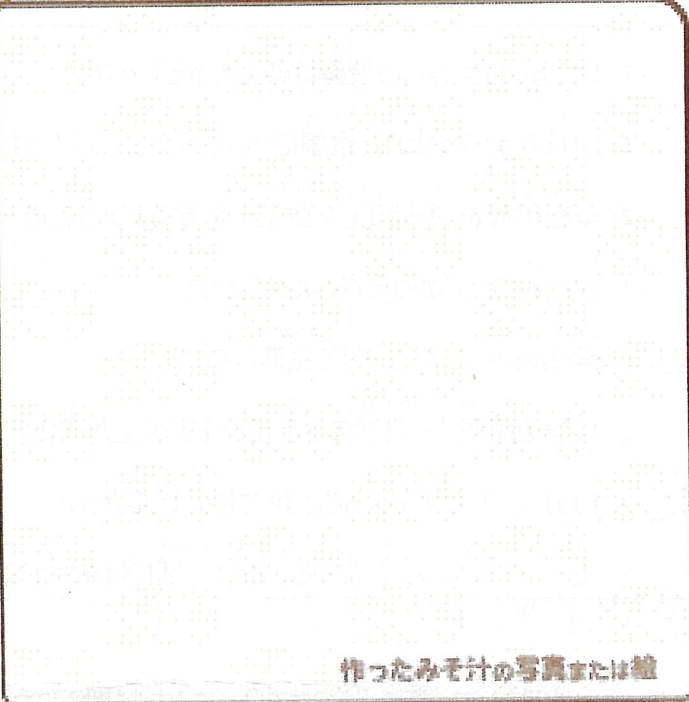
作ったみそ汁の写真または絵