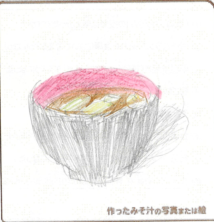
作ったみそ汁の写真または絵