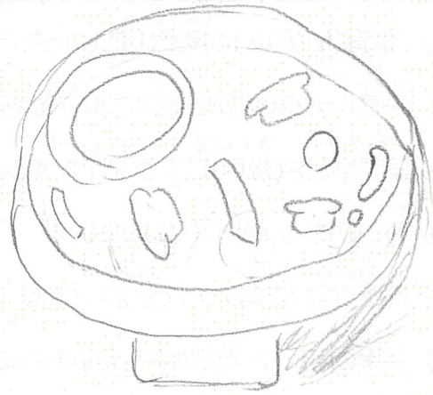
作ったみそ汁の写真または絵