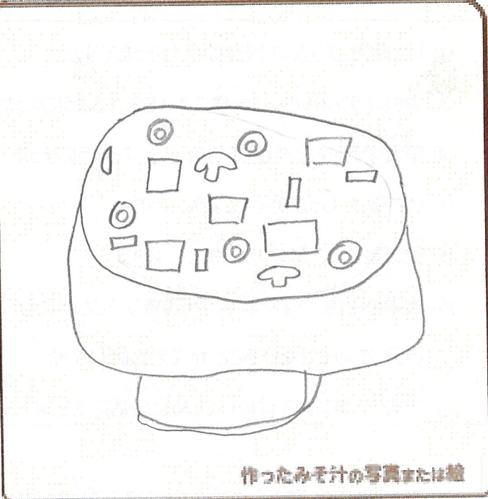
作ったみそ汁の写真または絵