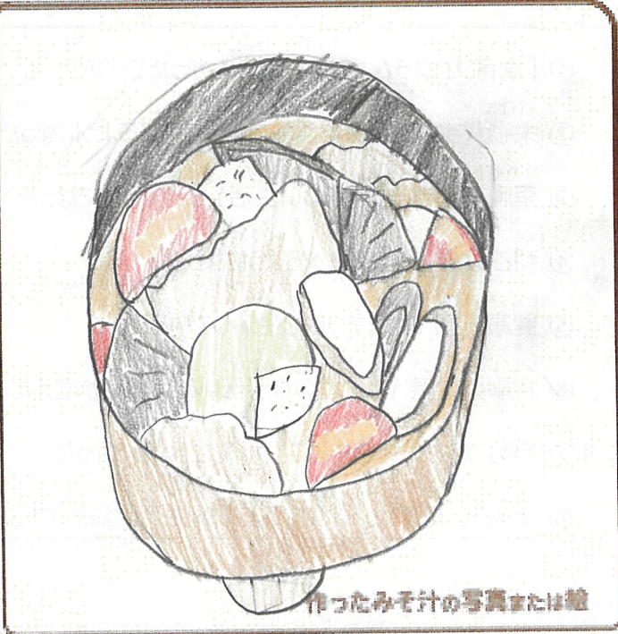
作ったみそ汁の写真または絵