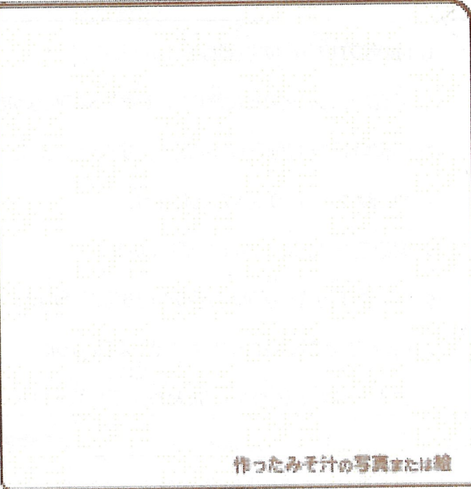
作ったみそ汁の写真または絵