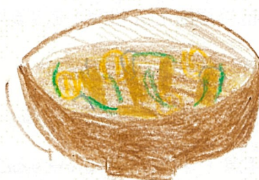
作ったみそ汁の写真または絵