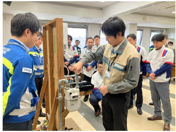
ガスメーター教育デモ機を用いた 復帰作業訓練