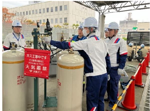
移動式ガス発生設備の組立訓練

※1：2022年4月20日プレスリリース「保安・安定供給の確保および都市ガスの普及拡大に向けた連携協定を締結」